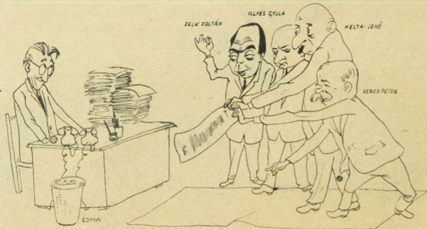
— Egy eredeti Tuli-novellát hoztunk!

Egyes fiatal írók nehezményezték, hogy nekik kell műveik elhelyezésével bajlódniuk, az volt a kívánságuk, hogy intézze ezt helyettük az Írószövetség.